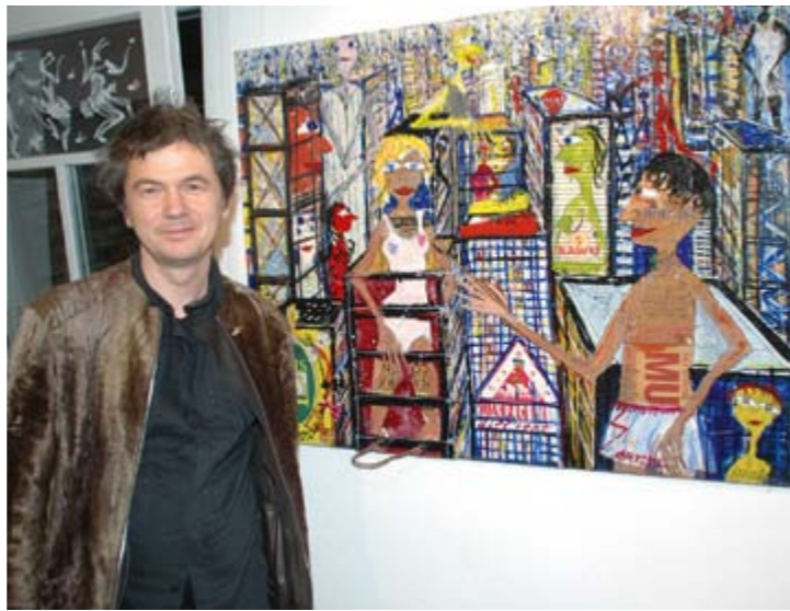
Thitz 2009, Bei der Ausstellungseröffnung in der Galerie Kunstblick, Balingen

Öffnungszeiten: Montag bis Donnerstag 8.00 - 18.00 Uhr Freitag 8.00 - 13.00 Uhr Samstag 9.00 - 13.00 Uhr