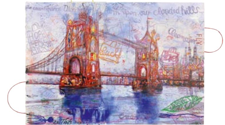
London, 2011, Übermalter Künstlersiebdruck auf Hahnemühle Büttenpapier und Tüten, 53 x 78 cm, Aufl. 40 Ex. (teilweise sehr unterschiedliche Übermalungen)