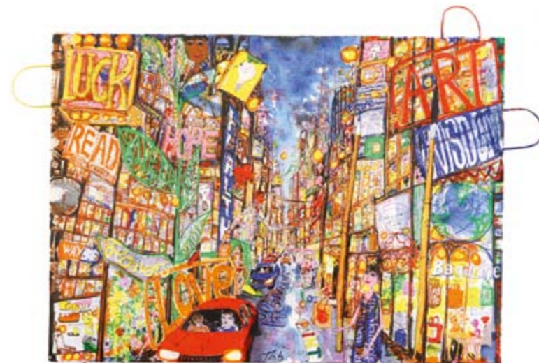
N.Y. Web City, 2011, Übermalter Künstlersiebdruck auf Hahnemühle Büttenpapier und Tüten, 78 x 107 cm, Aufl. 40 Ex. (teilweise sehr unterschiedliche Übermalungen)