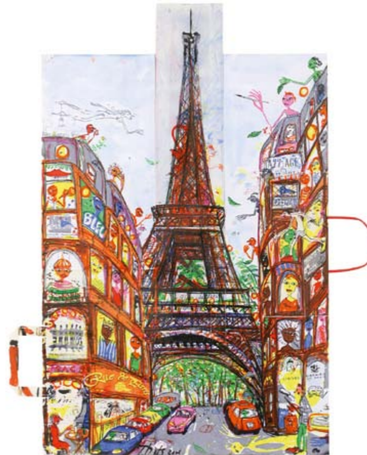
Rue de Paris, 2006, Künstlersiebdruck mit Übermalungen auf Tüten, 70 x 50 cm, Aufl. 40 Ex.