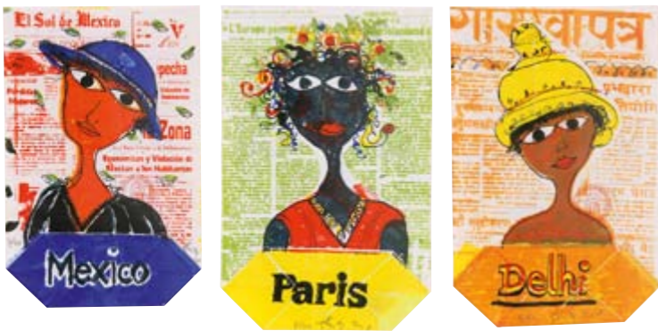
Mexico, Paris, Delhi, o. D., Künstlersiebdruck auf Tüten, je 30 x 18,5 cm

Eintritt zur Ausstellung ist frei Führungen am Sa. 23. Juli 11 Uhr, Mittwoch 17. August 17 Uhr, Sa. 3. September 11 Uhr und nach Vereinbarung