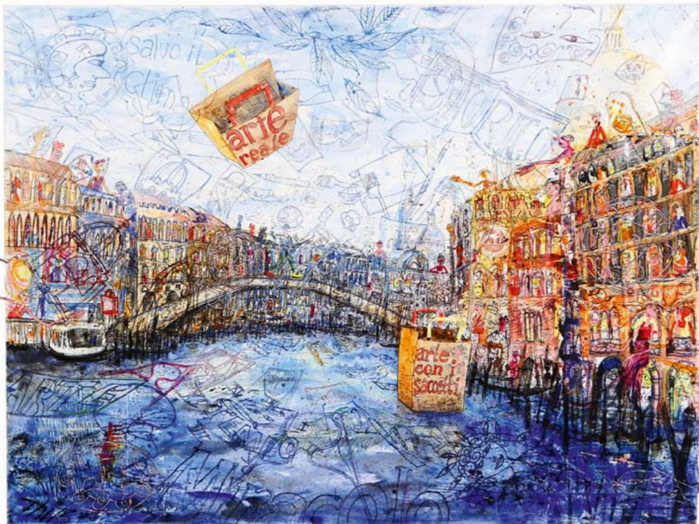
Oben: Venedig, 2010, Acryl und Tüten auf Leinwand, 120 x 160 cm Vorderseite: New York, Chelsea Hotel, 2008, Acryl und Tüten auf Leinwand, 140 x 100 cm